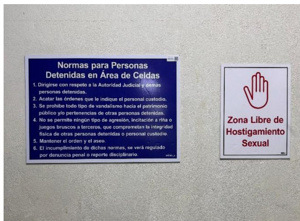
Fotografía de la izquierda: Rotulación informativa ubicada en el área de celdas de la sección de cárceles de los Tribunales de Justicia de Liberia. Fotografía de la derecha: Rotulación en el área de celdas de la Delegación Regional del OIJ de Liberia.