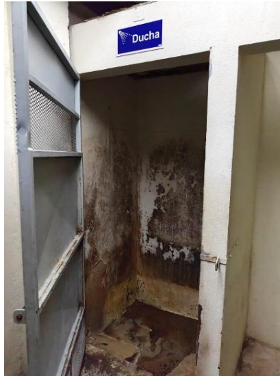
Foto: Ducha del área de celdas de la Delegación Regional del Organismo de Investigación Judicial de Liberia.